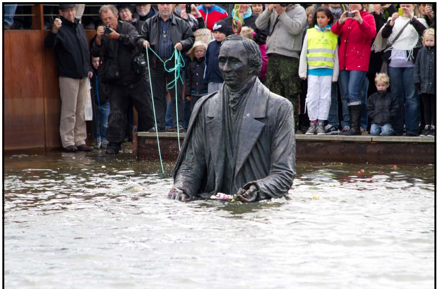
H.C.A skulpturen forlod Flakhaven d. 8 okt. 2011, og blev druknet I Odense havn,– hvor den stadig kan ses i inderhavnen ved havnepladsen