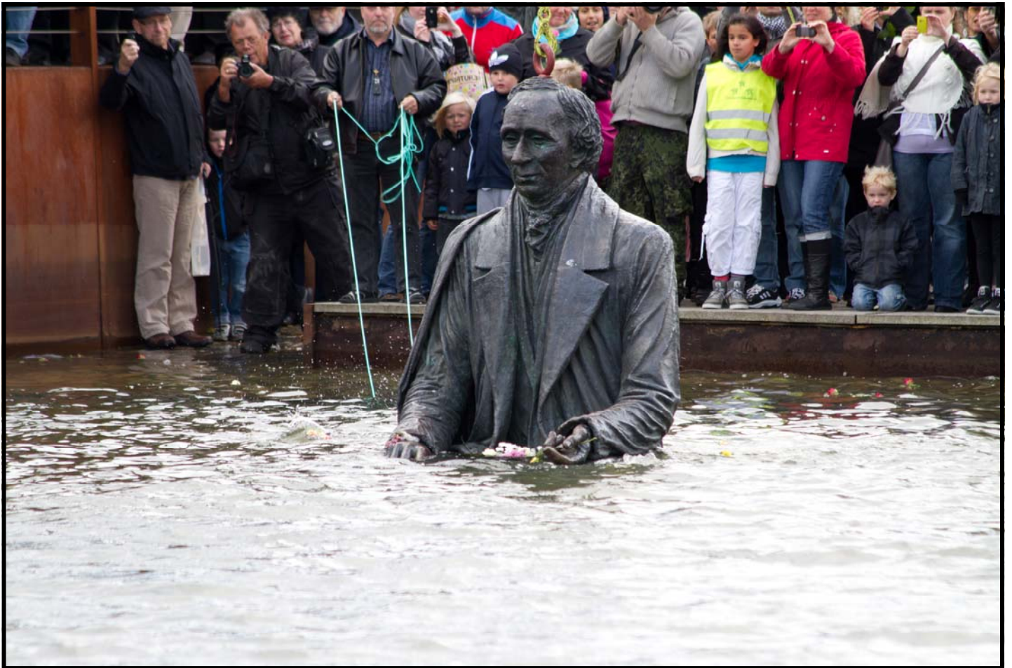
H.C.A skulpturen forlod Flakhaven d. 8 okt. 2011, og blev druknet I Odense havn,– hvor den stadig kan ses i inderhavnen ved havnepladsen