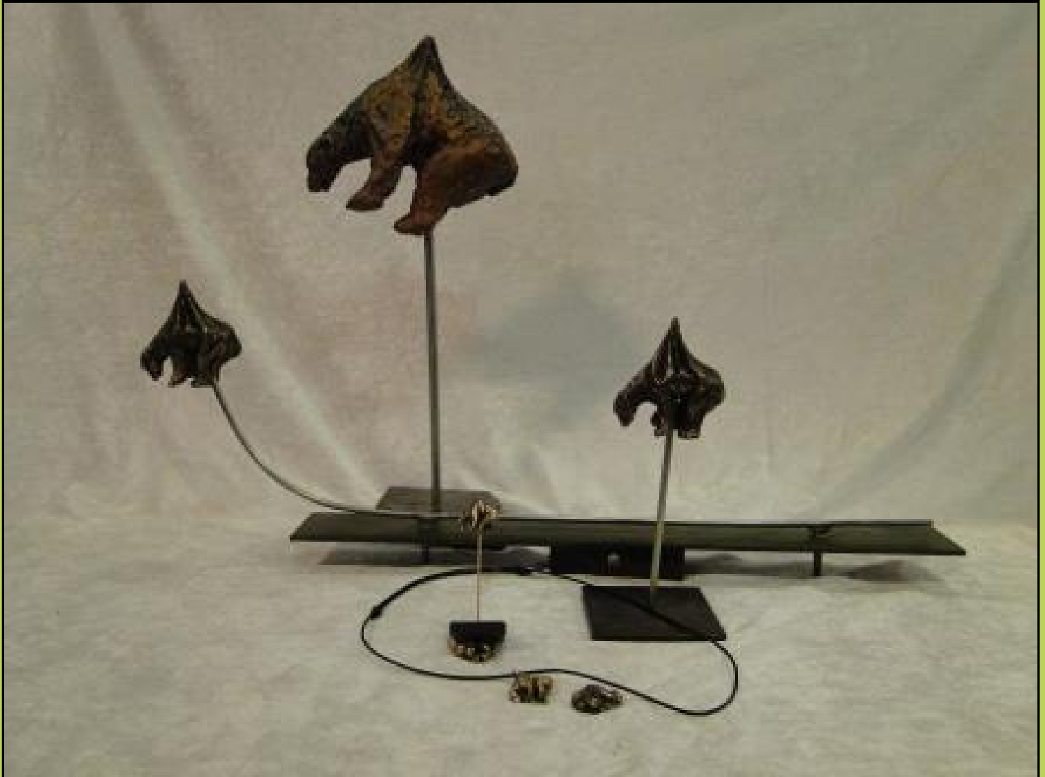
En samling af de skulpturer som vi har lavet til Crowdfunding som støtte til Unbearable (den spiddede isbjørn) i Paris:

8 dage til - onsdag 2. september kl. 18.00