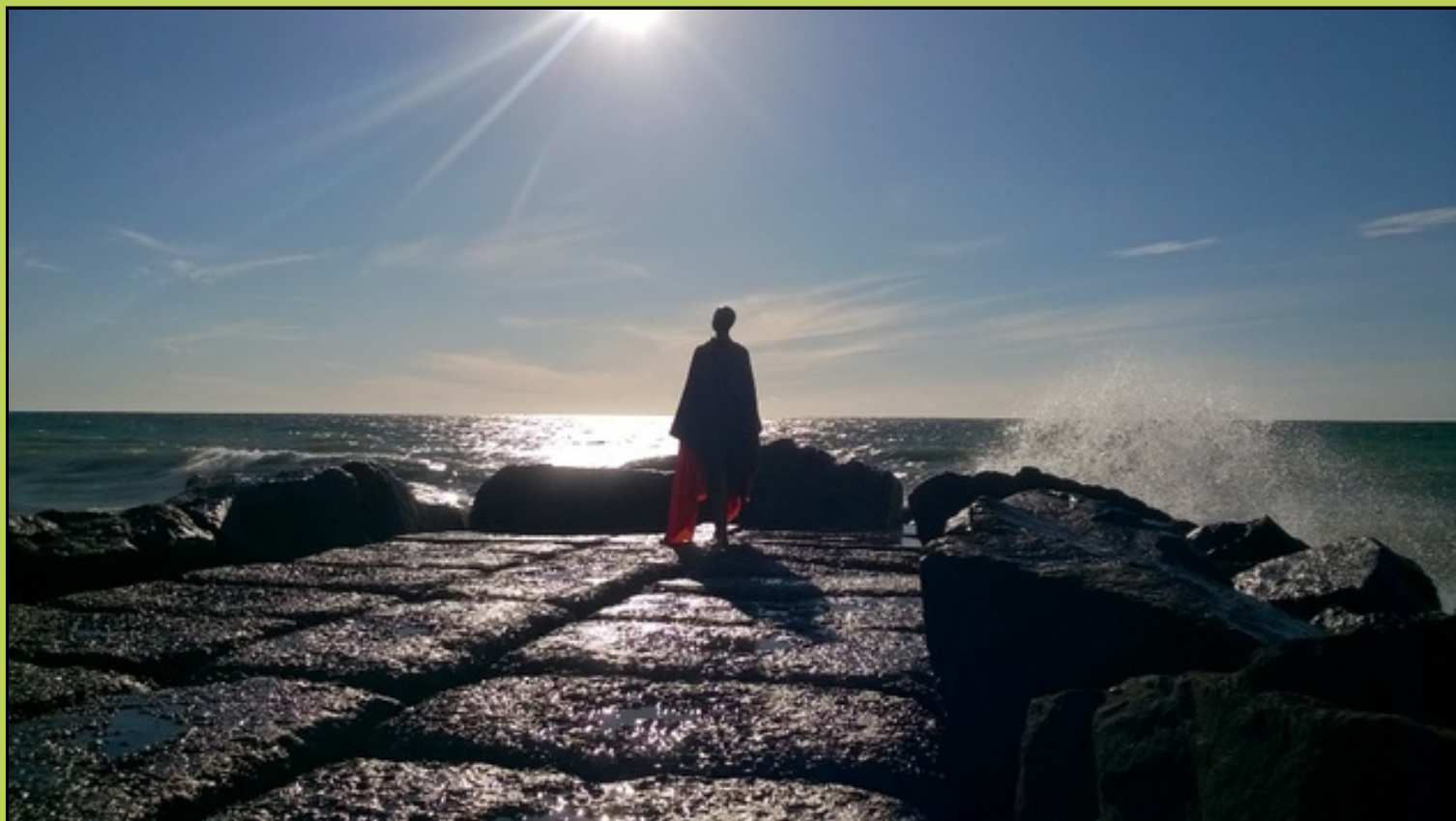
"Flygtningen der skuer mod en lysere fremtid, men havet er imellem!" Billede fra Høfte90, tak til Allan Riis Larsen