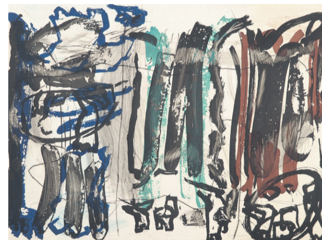
1500 værker af Per Kirkeby kan fra på lørdag ses på Museum Jørn.