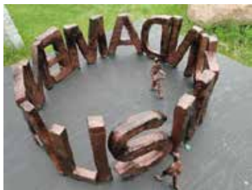
Model af Fundamentalism

Kulturhuset Birkelundgård har velvilligt stillet laden til rådighed for denne del af udstillingen.